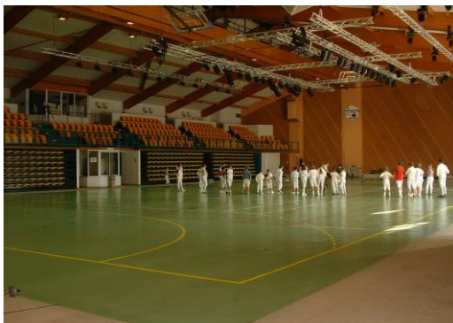
Le Gymnase (16 pistes)